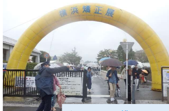
あいにくの雨☔でした