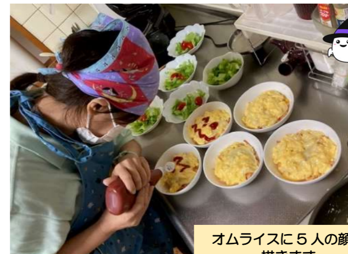
オムライスに5人の顔を描きます