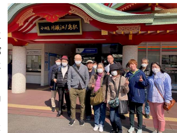
小田急線「片瀬江ノ島駅」 竜宮城をイメージしたもので、屋根にはシャチホコではなくイルカが乗っています。 (写真には写っていませんでした 泣)

仲見世通りの終点、赤い大鳥居。ここから「エスカー」というエスカレーターに乗って「江島神社」へ。