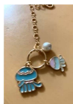
アコヤ貝のキーホルダー

早速お目当ての御朱印をゲットして満足するチーム。さらに頂上にある灯台「シーキャンドル」を目指していく元気なチーム。帰りは階段で下ることになると聞き、上へ行くことを断念して下で留守番しているチーム。皆さん自分の体調に合わせて行動することが出来ました。