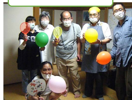
童心に帰って 風船遊び