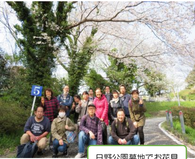
日野公園墓地でお花見