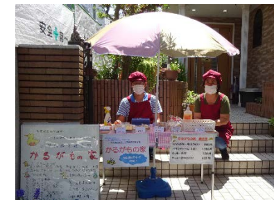
事業所玄関前での販売も再開

7月からは通所を通常の形式に戻す予定です! すれ違っていたメンバー同士の再会だったり、昼食ボラの方に会える日が待ち遠しいです。