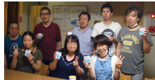
大家さんから頂いた牛乳です