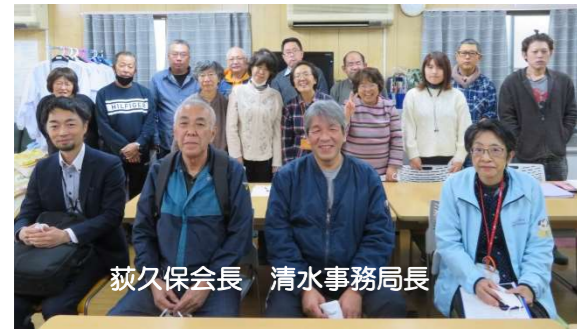
荻久保会長 清水事務局長