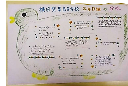
生徒さんたちからいただいたお手紙