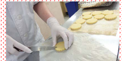
花びらを作ります