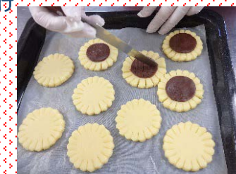
芯にラインを入れます