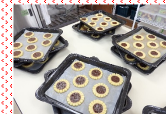
オープン入りを待つひまわり達