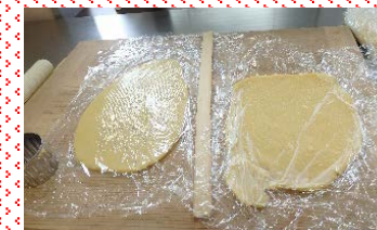
生地をのして型抜き